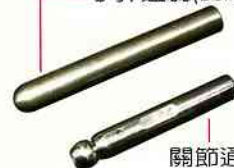
關節通蕊 (Ball Mandrel)