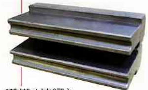
導模 (拉彎) (Pressure Die/Draw Bending)