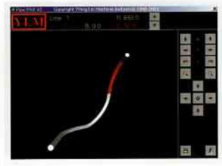
3D模擬 3D parts Visualization