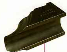
後導模 (Wiper Die)