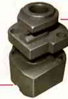
直徑模 (Bending Die)