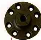
束頭 (Tube Collet)