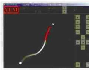
3D模擬 3D parts Visualization