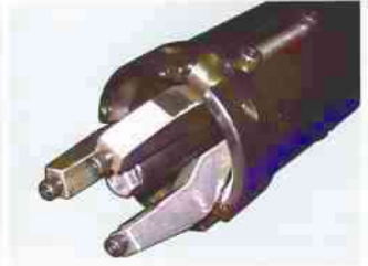
三爪束頭 3-Jaw Collet