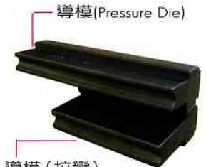
導模 (拉彎) (Pressure Die/Draw Bending)