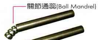
關節通蕊 (Ball Mandrel)