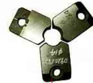
束頭 (Tube Collet)