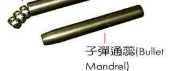
子彈通蕊 (Bullet Mandrel)