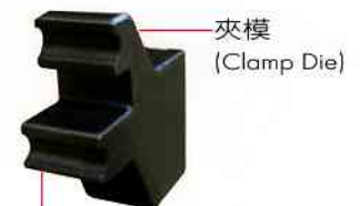
夾模 (拉彎) (Clamp Die/Draw Bending)