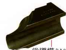
後導模 (Wiper Die)