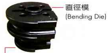
直徑模 (拉彎) (Bending Die/Draw Bending)