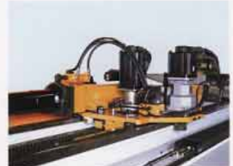
伺服強力輔推 (專利技術) Servo Controlled Strong POB Boost (Patented)